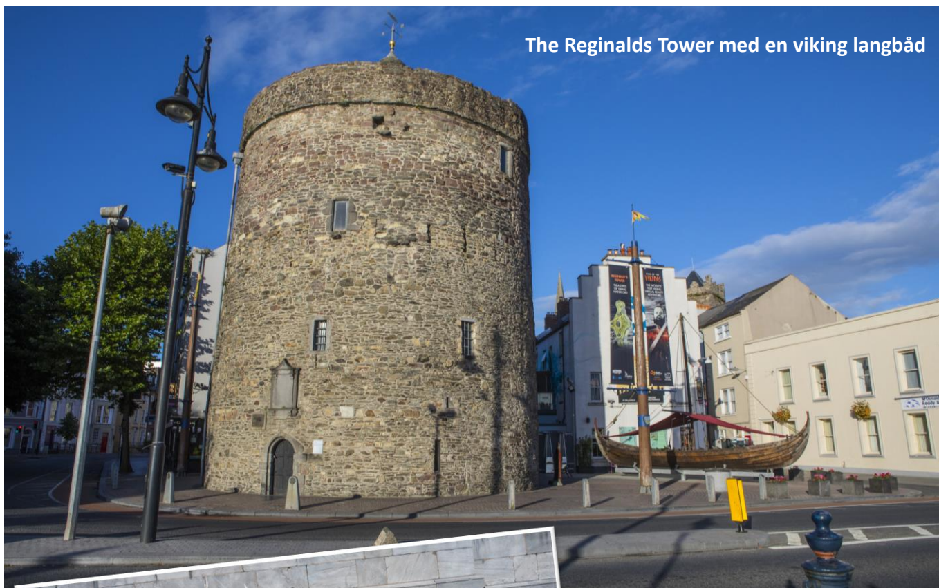
The Reginalds Tower med en viking langbåd

Derefter skal vi fokusere på the Viking Triangle, hvor vi kan se The Beach Tower, Bishops Palace, The Clock Tower, the Half Moon Tower samt Reginalds Tower. Resten af dagen er fri.